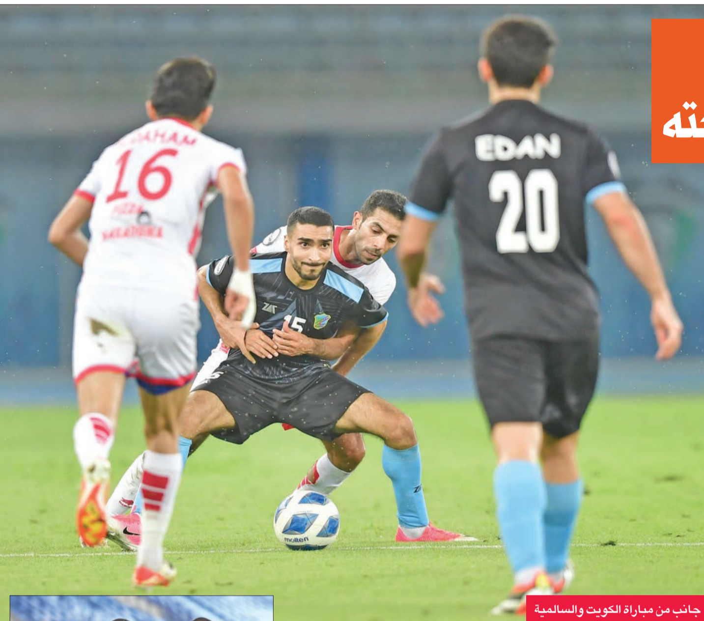
جانب من مباراة الكويت والسالمية