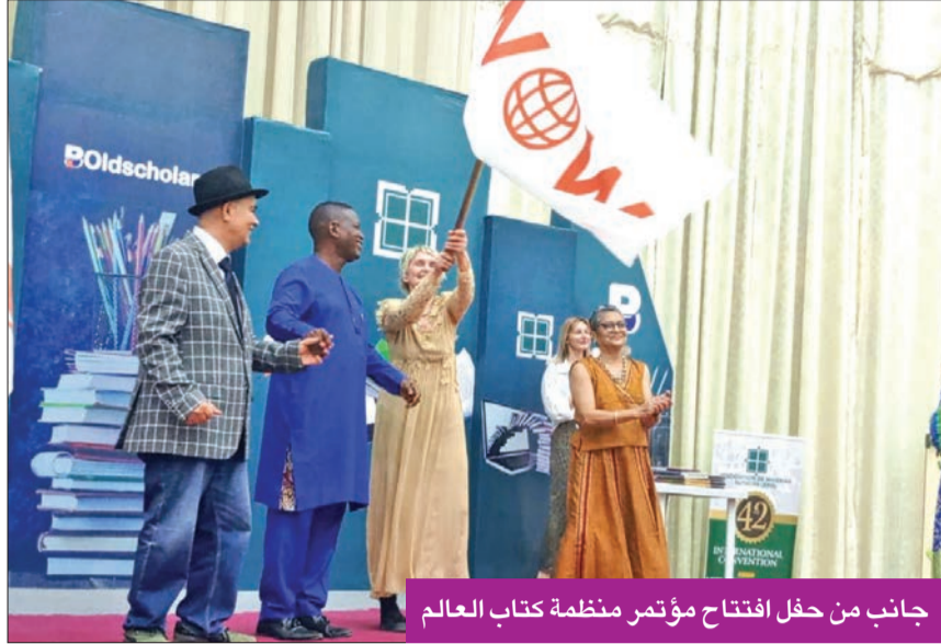
جانب من حفل افتتاح مؤتمر منظمة كتاب العالم