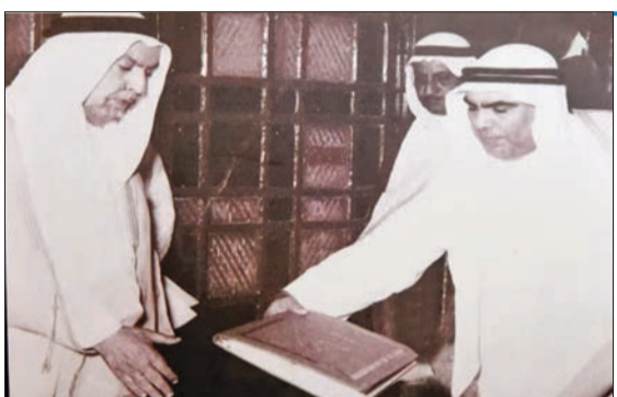
رئيس المجلس التأسيسي يسلم عبدالله السالم الدستور الكويتي

رئيس مجلس الوزراء، المادة 106 للامير أن يؤجل بمرسوم اجتماع مجلس الأمة لمدة لا تتجاوز شهراً، ولا يتكرر التأجيل في دور الانعقاد الواحد إلا بموافقة المجلس ولمدة واحدة، ولا تحسب مدة التأجيل ضمن فترة الانعقاد.