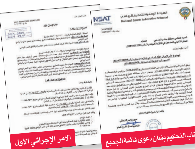
الاصر الإجرائي الأول

الجدعي: غير ملازم وليس رفضاً لشكوى «الجميع»