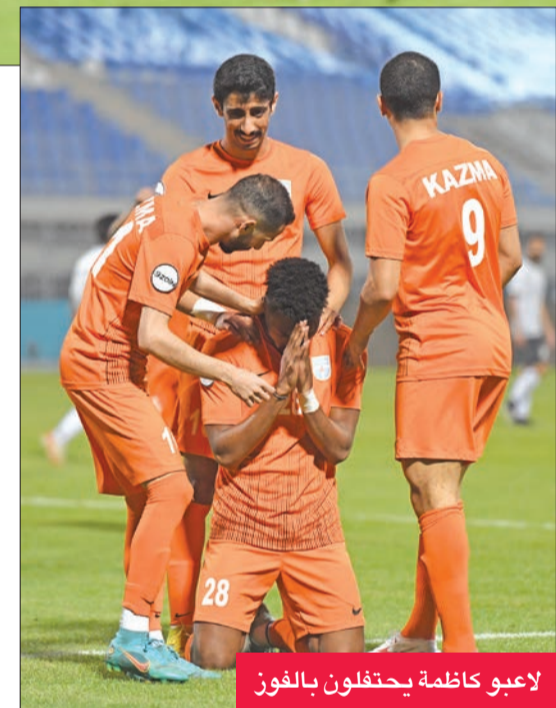
لاعبو كاظمة يحتفلون بالفوز

ارتفع مستوى كاظمة بشكل لافت للنظر، وطم فارق كبير بينه وبين منافسيه في هذه المجموعة. ويحتاج كاظمة صاحب المركز السابع برصيد 26 إلى نقطة واحدة من مواجهة الشباب التاسع وله 14 نقطة للبقاء رسمياً في البطولة، بينما ستظل المنافسة على تذكرة اللقاء الثانية حتى نهاية المجموعة، لا سيما في حال تحقيق الجواهر الأخير وله 11 نقطة الفوز على خطان السابع برصيد 15 نقطة، لكن نظراً تبدو فرصة خطان الأقوى في البقاء.