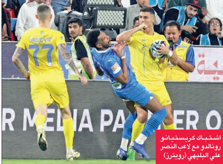
اشتباك كريستيانو رونالدو مع لاعب النصر علي البليهي

باللقب (3 مرات اعوام 2015 و 2018 و 2021)، وفي المباراة الثانية، قاد المهاجم الفرنسي كريم بنزيمة فرقة الاتحاد إلى النهائي بعد الفوز على الوحدة 2-1 على ملعب آل نهيان. سجل للاتحاد مهاجم ريال مدريد الإسباني السابق بنزيمة الهدف الأول بعد 55 ثانية فقط من انطلاق المباراة قبل أن يعزز المغربي عبدالرزاق حمدالله النتيجة لفرقة قبل نهاية الشوط الأول (42)، وقلص حسن