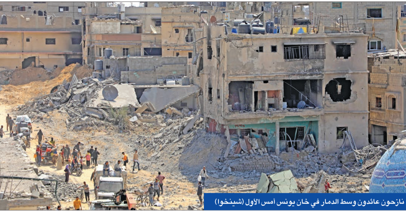
نازحون عائدون وسط الدمار في خان يونس أمس الأول

على صادراتها لإسرائيل حتى يتم وقف إطلاق النار بغزة، وهو ما دفع الأخيرة إلى التعهد بفرض خطوات اقتصادية انتقامية ضد السلع التركية. وفرضت انقرة، التي تنتقد بشدة الأعمال العسكرية الإسرائيلية في غزة، لأول مرة، قيودا على صادرات 54 نوعا من المنتجات إلى تل أبيب باثر فوري، وتشمل الصادرات منتجات الألمنيوم والصلب ومنتجات البناء ووقود الطائرات والأسمدة الكيماوية. وردا على القيود التجارية التركية، أعلنت إسرائيل أنها تستعد لفرض حظر على المنتجات التركية، متهمه الرئيس رجب طيب أردوغان بأنه يضي بمصالح تركيا من أجل دعم «حماس».