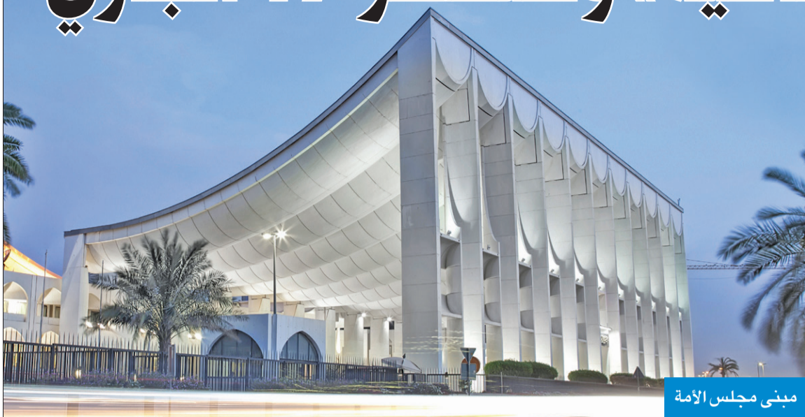
مبنى مجلس الأمة

بعد صدور مرسوم أميري بعقدها 14 مايو المقبل