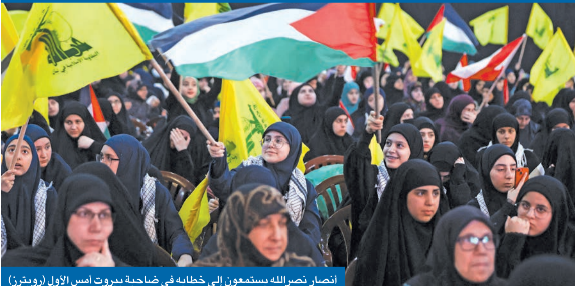
انصار نصرالله يستمعون إلى خطابه في ضاحية بيروت أمس الأول

«القوات» و«الكتائب» يرفضان تحقيقات قيادة الجيش في جريمة خطف وقتل باسكال سليمان نصر الله يتهم الحزبين بتهديد الشيعة في جبيل وكسروان والبحث عن الحرب الأهلية