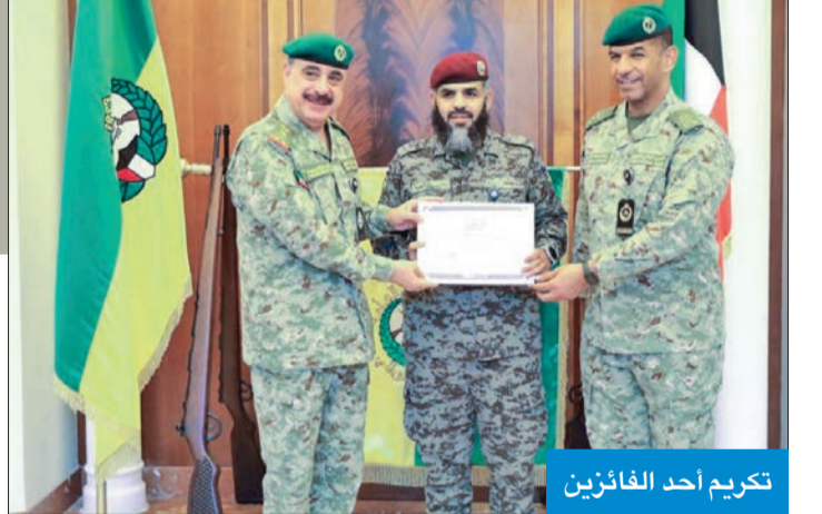
تكريم أحد الفائزين

رئيس الحرس الوطني سمو الشيخ سالم العلي الصباح، ونائب رئيس الحرس الشيخ فيصل النواف. وأشاد بالمستوى الذي قدمه منتسبو الحرس الوطني في المسابقة، مؤكداً أن الاعتناء بكتاب الله عز وجل وحفظه وتدارسه عامل أساسي في تكوين شخصية