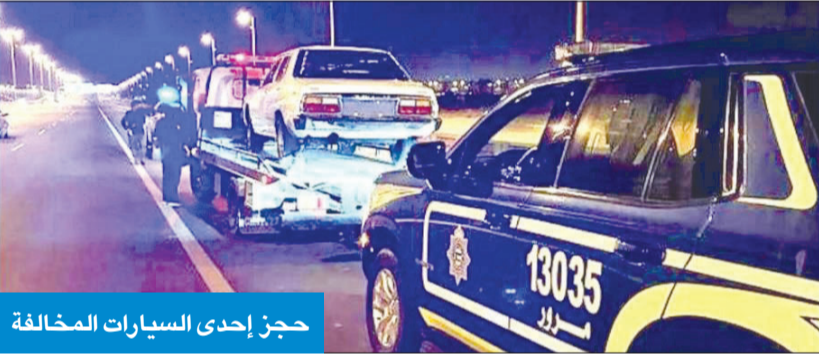
حجز إحدى السيارات المخالفة

إحالة 23 إلى نيابة الأحداث لقيادتهم مركبات بدون رخص قيادة