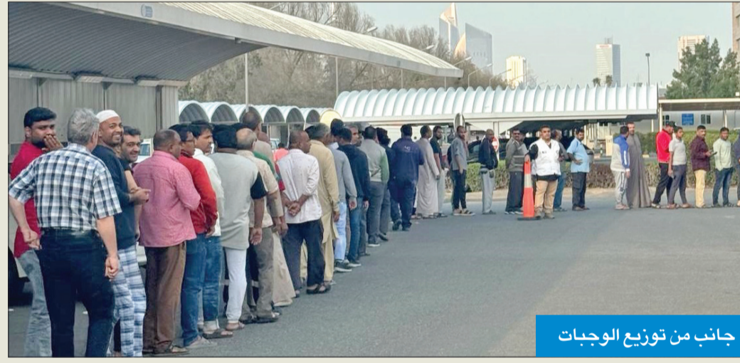
جانب من توزيع الوجبات

وزعت جمعية الهلال الأحمر الكويتي، في مقرها أمس الأول، 1600 وجبة على العمالة، ضمن مشروعها الخيري (إفطار الصائم) في شهر رمضان، الذي يهدف إلى مساعدة المحتاجين.