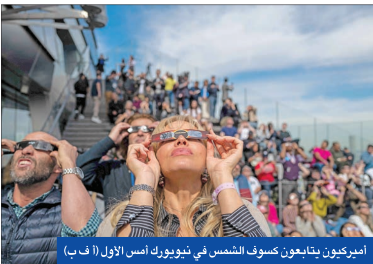
أميريكيون يتابعون كسوف الشمس في نيويورك أمس الأول

ولم يتأخر جو بايدن في الرد على تصريحات منافسه الحذرة، وقال ساخرا إن ترامب «يخشى أن يحاسبه الناخبون» في