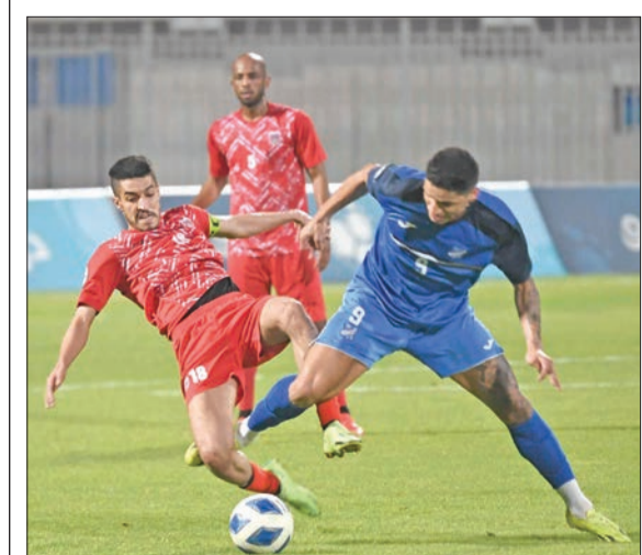
جانب من مباراة التضامن والصليبيخات